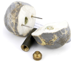
SKRYTKI I KONTENERY