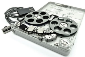
RADIOWY I ELEKTRONICZNY SPRZĘT WYWIADOWCZY