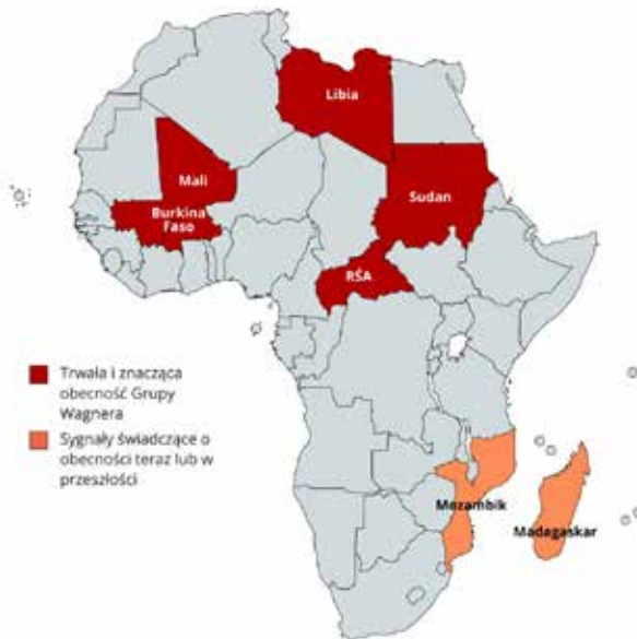
Rysunek 1. Państwa w Afryce, w których działa bądź działała Grupa Wagnera.

W wymiarze globalnym Grupa Wagnera mogła działać, w mniejszym lub większym zakresie, w ok. 30 państwach, m.in. w Europie Wschodniej (np. w Ukrainie), na Bliskim Wschodzie (np. w Syrii) i Ameryce Południowej (np. w Wenezueli), ale najbardziej widoczna jest jej obecność na kontynencie afrykańskim. To zaangażowanie, mające wpływ na sytuację wewnętrzną państw oraz na ich politykę zagraniczną, dotyczy przede wszystkim Mali, Burkina Faso, Libii, Republiki Środkowoafrykańskiej (RŚA) i Sudanu (rysunek 1). Wpływy wagnerowców na tym kontynencie sięgają jednak znacznie szerzej, o czym traktuje niniejsza analiza 7 .