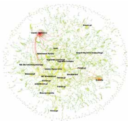
Diagram 2. Wizualizacja sieci powiązań między kontami publikującymi hasło rusofob* w serwisie społecznościowym Facebook w okresie styczeń–kwiecień 2022 r. Na diagramie zaznaczono 20 profili wyróżniających się pod względem koncentrowania dyskusji.