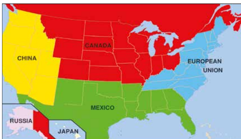
Mapa 2. „Bałkanizacja” Stanów Zjednoczonych według Igora Panarina.

dla stacji RT, Panarin nawiązał do swojej prognozy, którą uznał za aktualną. Według niego czas pokazał, że Stany Zjednoczone nadal nie mogą rozwiązać problemów gospodarczych i społecznych, a kryzys ekonomiczny z 2008 r. jeszcze bardziej je pogłębił. Co więcej, stwierdził, że USA mogą stać w obliczu „bałkanizacji” i „drugiej wojny domowej”, którą w 2020 r. wywołają konflikty na tle rasowym (sic!) 85 .