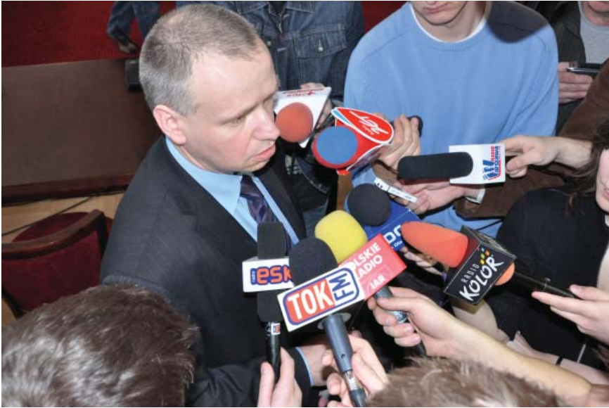
Zdj. 3. Mazowiecki Urząd Wojewódzki – Warszawa, 29.03.2011 r. Seminarium poświęcone projektowi ABW pt. Działania antyterrorystyczne podczas międzynarodowych imprez sportowych. Rola Narodowych Centrów Antyterrorystycznych.