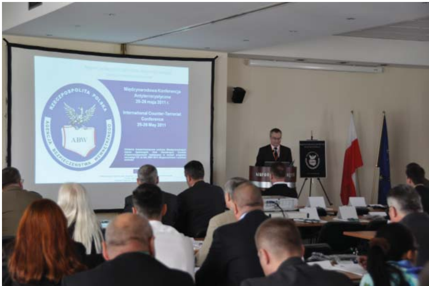
Zdj. 4. Konferencja międzynarodowa pt. Działania antyterrorystyczne podczas międzynarodowych imprez sportowych. Rola Narodowych Centrów Antyterrorystycznych. Warszawa, 25 - 26.05.2011 r.