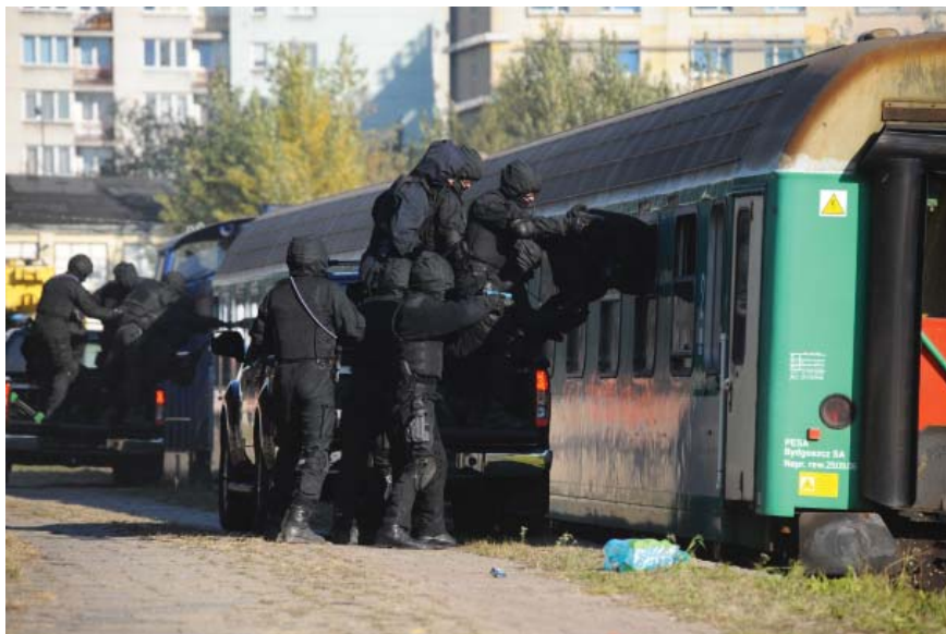
Zdj. 1. Funkcjonariusze ABW podczas ćwiczeń OFFSIDE 2010 .