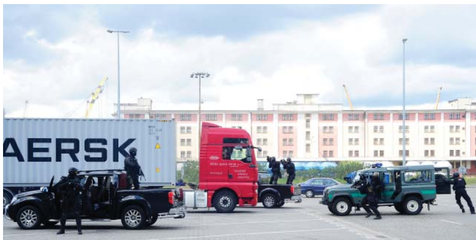
Zdj. 3. Zatrzymanie członków zorganizowanej grupy przestępczej przez funkcjonariuszy ABW i SG.

Wymiernym efektem dyskusji prowadzonych podczas poszczególnych etapów projektu, a także wynikiem innowacyjności projektu, opartego na rozwoju interoperacyjności transgranicznej w identyfikacji oraz zwalczaniu azjatyckich zorganizowanych grup przestępczych było wypracowanie przez wszystkich partnerów projektu rekomendacji, które odwołują się do najlepszych praktyk stanowiących o bezpieczeństwie ekonomicznym Unii Europejskiej.