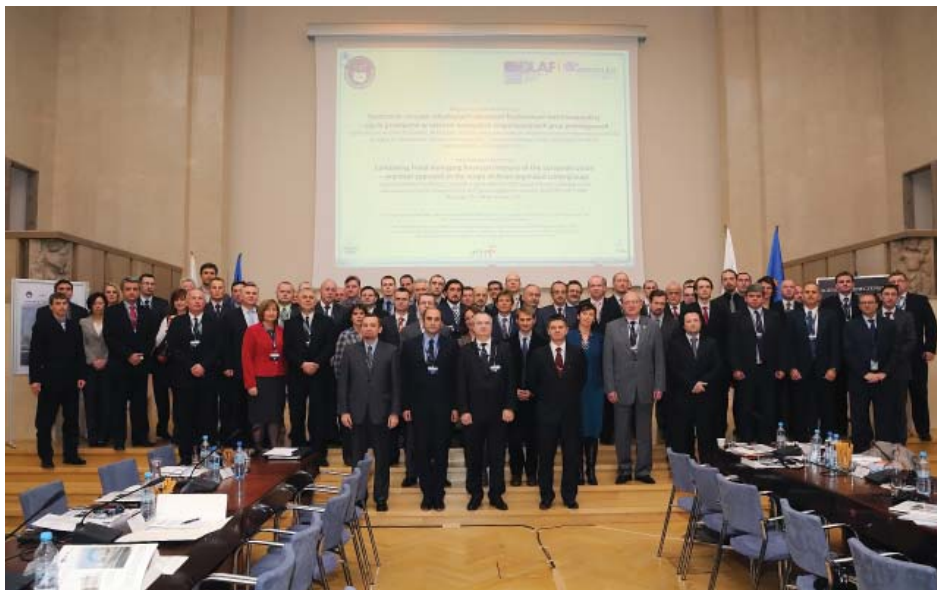
Zdj. 1. Uczestnicy międzynarodowej konferencji Zwalczanie oszustw szkodzących interesom finansowym Unii Europejskiej – ujęcie praktyczne w zakresie azjatyckich zorganizowanych grup przestępczych , Warszawa, 23–24 listopada 2011 r.

Pierwszym etapem przedmiotowego projektu była międzynarodowa konferencja pt. Zwalczanie oszustw szkodzących interesom finansowym Unii Europejskiej – ujęcie praktyczne w zakresie azjatyckich zorganizowanych grup przestępczych , która odbyła się w Kancelarii Prezesa Rady Ministrów w Warszawie w dniach 23–24 listopada 2011 r. Uczestniczyli w niej delegaci kilkudziesięciu krajowych i zagranicznych służb i instytucji powołanych do zwalczania przestępczości zorganizowanej. Konferencja posłużyła do stworzenia forum dyskusyjnego na temat azjatyckich zorganizowanych grup przestępczych. W trakcie wystąpień poruszano problem uwarunkowań prawnych związanych ze zwalczaniem tych grup, wytypowano obszary zagrożeń dla państw członkowskich Unii, a także wskazano kierunki współpracy europejskich służb i instytucji na poziomie krajowym oraz międzynarodowym.