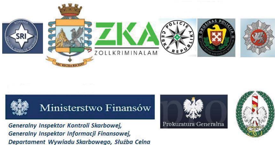
Rys. 1. Partnerzy ABW w projekcie.

W dniu 31 sierpnia 2012 r. Agencja Bezpieczeństwa Wewnętrznego zakończyła projekt pt. W kierunku bardziej efektywnego zwalczania zorganizowanej przestępczości azjatyckiej godzącej w ekonomiczne interesy Unii Europejskiej 1 . Projekt ten był współfinansowany przez Komisję Europejską (OLAF – Europejski Urząd ds. Zwalczania Nadużyć Finansowych) w ramach Programu Hercule II na lata 2007–2013: Program na rzecz wspierania działalności w dziedzinie ochrony interesów finansowych Unii Europejskiej 2 .