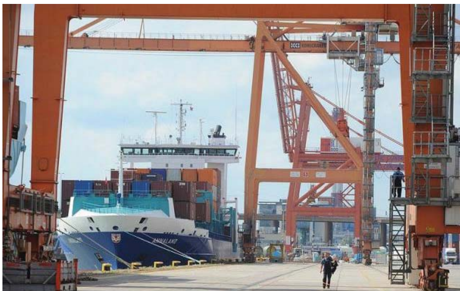
Zdj. 2. Terminal kontenerowy na terenie Portu Morskiego w Gdyni.

Aktywny udział krajowych i zagranicznych partnerów w poszczególnych etapach projektu, a zwłaszcza w międzynarodowym treningu połączonym z ćwiczeniami, zatytułowanym Praktyczne aspekty przesyłki niejawnie nadzorowanej w kontekście zwalczania azjatyckich zorganizowanych grup przestępczych , który odbył się w dniach 29–31 maja 2012 r., stanowił podsumowanie projektu. Jednocześnie stał się silnym bodźcem do zintensyfikowania współpracy opartej na wzajemnym zaufaniu i zrozumieniu w podejmowanych działaniach analitycznych i operacyjnych. Celem organizatorów treningu była przede wszystkim realizacja praktycznych ćwiczeń polegających na przetestowaniu współpracy i koordynacji działań pomiędzy uczestnikami projektu w zakresie przygotowania i przeprowadzenia procedury przesyłki niejawnie nadzorowanej oraz realizacji procesowej. Międzynarodowy trening połączony z ćwiczeniami praktycznymi pozwolił przedstawicielom Agencji Bezpieczeństwa Wewnętrznego oraz krajowym i zagranicznym partnerom na wypracowanie dobrych praktyk i know-how w zakresie zwalczania azjatyckiej przestępczości zorganizowanej, a także na usprawnienie i ujednoczenie procedur przekazywania i wymiany informacji służących poszerzeniu współpracy służb zwalczających azjatycką zorganizowaną przestępczość ekonomiczną.