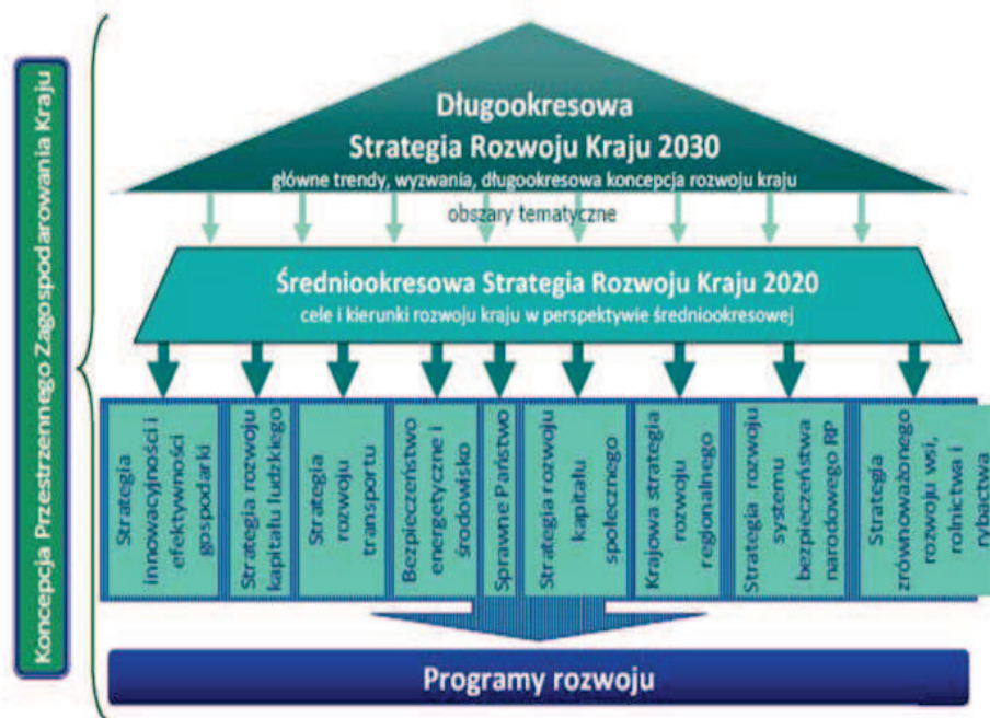
Schemat 1. Hierarchiczność dokumentów strategicznych na podstawie ustawy o zasadach prowadzenia polityki rozwoju oraz Planu uporządkowania strategii rozwoju 6 .