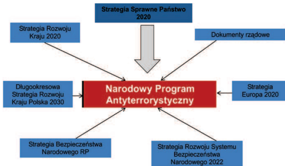
Schemat 2. Strategiczne podstawy NPA.

Źródło: Opracowanie własne na podstawie projektu Narodowego Programu Antyterrorystycznego na lata 2015–2019 , http://bip.msw.gov.pl/bip/projekty-aktow-prawnyc/2014/22861,Projekt-uchwaly-Rady-Ministrow-w-sprawie-Narodowego-Programu-Antyterrorystycznego.html , s. 4 [dostęp: 24 XI 2014] 17 .