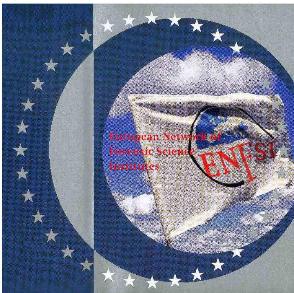
Rys. 1 European Network of Forensic Science Institutes

Tegoroczna konferencja była szczególna dla Agencji Bezpieczeństwa Wewnętrznego z powodu przyjęcia Biura Badań Kryminalistycznych ABW (BBK ABW) – pierwszego laboratorium służb specjalnych – w kręgi członków Europejskiej Sieci Laboratoriów Kryminalistycznych.