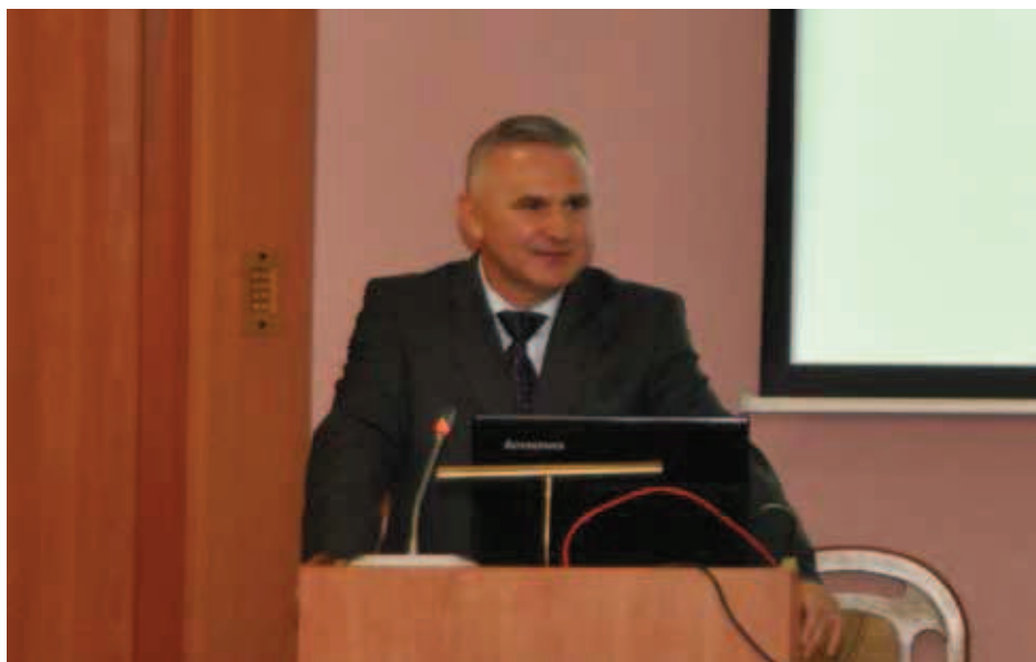
Zdjęcie 3. Zastępca szefa ABW mec. Kazimierz Mordaszewski.